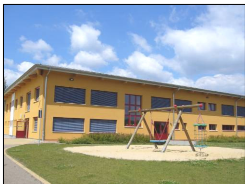
Serbska zakładna šula Ralbicy